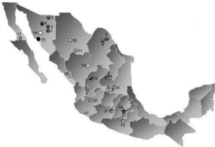
GRÁFICA 2. UNIDADES DE MINERA DE MÉXICO (GRUPO MÉXICO)

de la familia Guggenheim en México regresaban a las manos de capitalistas mexicanos, algunos de ellos considerados entre los más ricos del país. Las propiedades mineras de este grupo son muy numerosas tanto en México como en otros países de América Latina (Gráficas 2 y 3), así como Estados Unidos, Canadá, Australia e Irlanda. Se trata de la segunda compañía mundial y primera en estar listada públicamente en los mercados de valores en términos de reservas de mineral de cobre y producción de molibdeno, plata, zinc, así como oro, carbón y ácido sulfúrico, entre otros. Además, es la segunda compañía en el mundo con mayores reservas de cobre, la tercera productora de cobre, la segunda de molibdeno, la cuarta de plata y la octava de zinc.