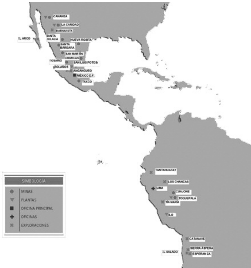
GRÁFICA 3. LA PRESENCIA DEL GRUPO MÉXICO EN AMÉRICA LATINA