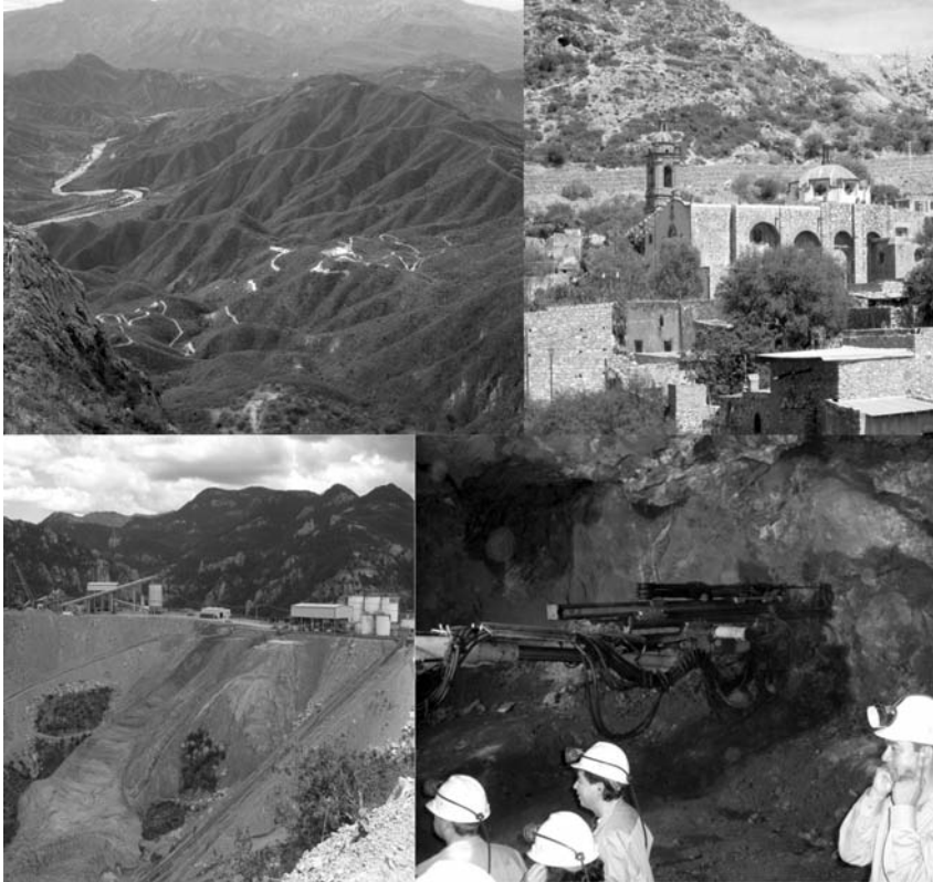
FOTOS 1. ASENTAMIENTO MINERO DEL SAUZAL EN LA SIERRA TARAHUMARA DE CHIHUAHUA, TAJO MINERO CERCANO AL PUEBLO DE CERRO DE SAN PEDRO EN SAN LUÍS POTOSÍ, DEPÓSITOS DE MINERAL PARA LIXIVIACIÓN EN LA MINA DE OCAMPO, CHIHUAHUA Y MAQUINARIA DE PERFORACIÓN EN LA MINA DE SANTA MARIA DE LA PAZ EN SAN LUÍS POTOSÍ