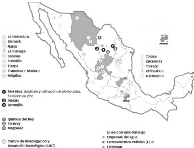
GRÁFICA 4. UNIDADES MINERO-METALÚRGICAS DEL GRUPO PEÑOLAS, 2007